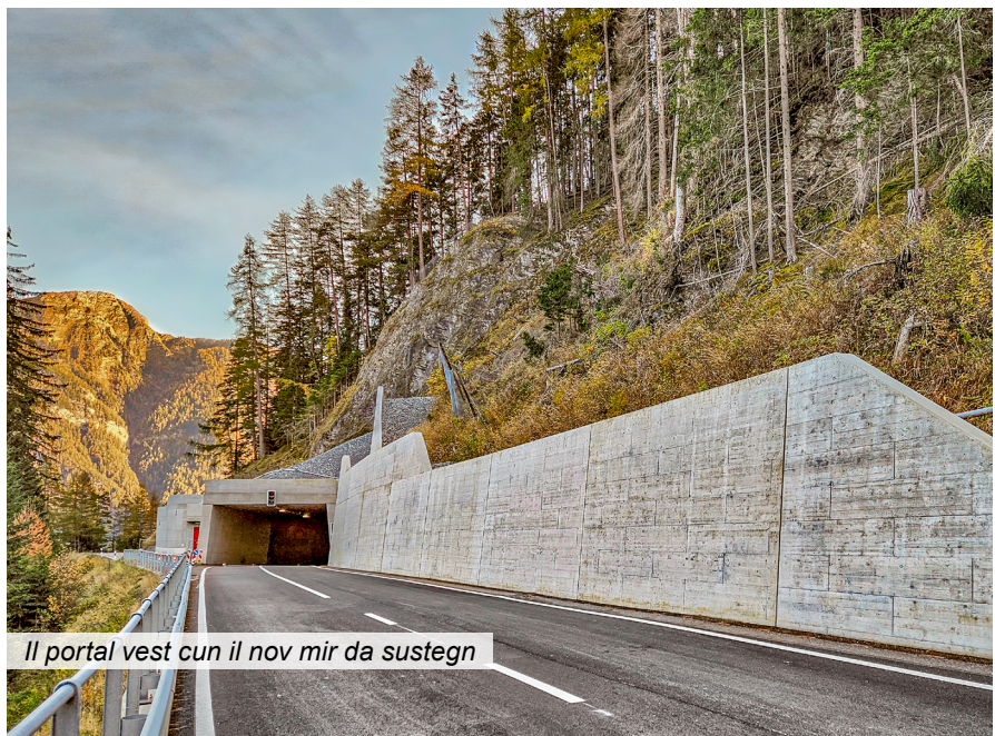
Il portal vest cun il nov mir da sustegn

Er durant las lavurs da construcziun ha la natira mussà en questa val selvadia ina giada dapli pertge che l'amplificaziun da questa via chantunala da colliaziun è da gronda impurtanza: durant las lavurs per l'emprima exchavaziun ost è vegnida giu ina bova che ha sutterrà per part il fossal segirà. Per consequenza ha il project en l'ost stui vegnir revedì cumpletmain per pudair cuntinuar cun las lavurs da cons-