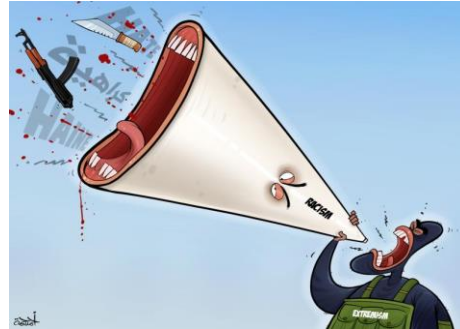
Discorsi di odio. Cartone animato di Ahmad Rahma: https://cartoonmovement.com/cartoon/hate-speech-9

"...solo un arbitro cieco non ci può fermare, arbitro, so dove si trova la tua auto" recita la traduzione di uno spezzone della canzone dell'artista Baschi "Chumm bring en heil!". Ciò che qui nel testo della canzone passa come libertà artistica, potrebbe essere interpretato nel contesto sociale e politico come una minaccia implicita.