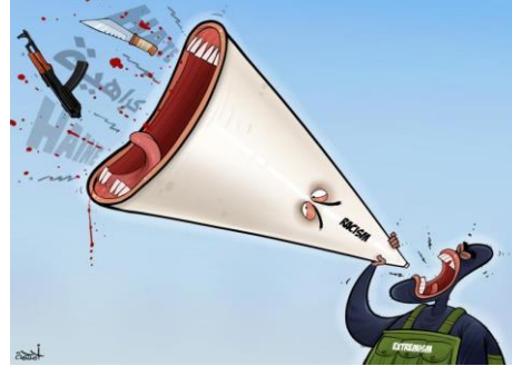
Hate speech. Cartoon by Ahmad Rahma: https://cartoonmovement.com/cartoon/hate-speech-9

«... nume no e blinde Schiri chan eus no schotpe, Schiri, i weiss, wo dis Auto schtoht», uschia hai num en la chanzun «Chumm bring en Hei!» da l'artist Baschi. Quai ch'ins po vesair sco libertad artistica en il text da la chanzun, pudess vegnir enclieg senz'auter sco smanatscha subtila en in context social e politic.