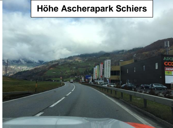
Höhe Ascherapark Schiers