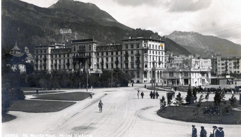
© es besteht kein Copyright mehr