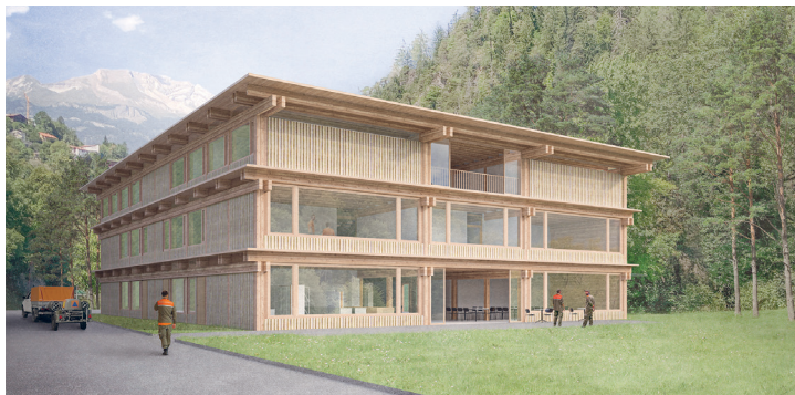
Illustraziun 3: Visualisaziun da la perspectiva externa

Il spazi exterior vegn creà en moda decenta e, tenor ils principis da la biodiversità, cun plantas indigenas.