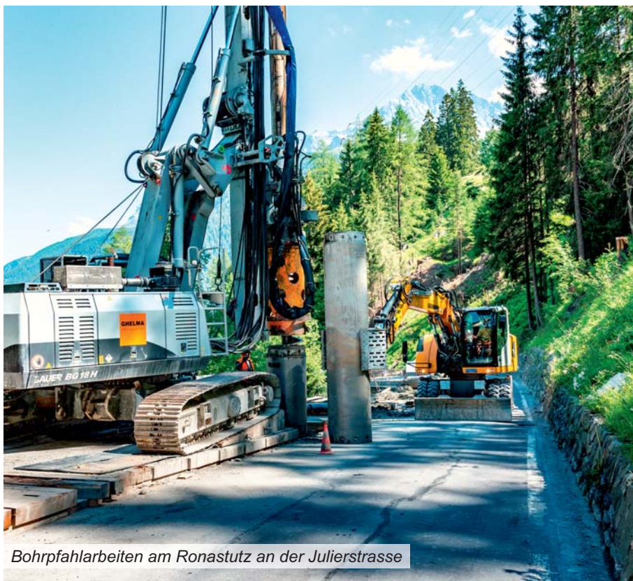
Bohrpfahlarbeiten am Ronastutz an der Julierstrasse

Liegt eine Baustelle auf meinem Arbeitsweg? Die aktuelle Baustellenkarte und -liste mit detaillierten Angaben zu den Arbeiten und Behinderungen informieren auf www.strassen.gr.ch .